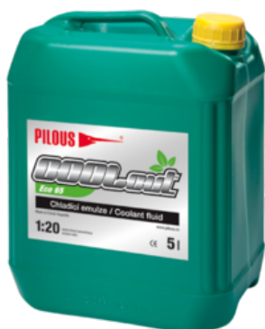
COOLcut Eco 65

Mimo použití na pásových pilách je určen i pro obráběcí operace prováděné jak na konvenčních obráběcích strojích, tak i na NC a CNC obráběcích centrech.