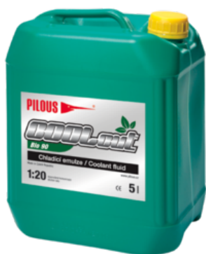
COOLcut Bio 90

Mimo použití na pásových pilách je určen i pro obráběcí operace prováděné jak na konvenčních obráběcích strojích, tak i na NC a CNC obráběcích centrech.